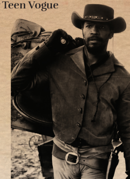
Film Django Unchained de Quentin Tarantino

Quavo pour Wonderland Magazine - Juillet 2018