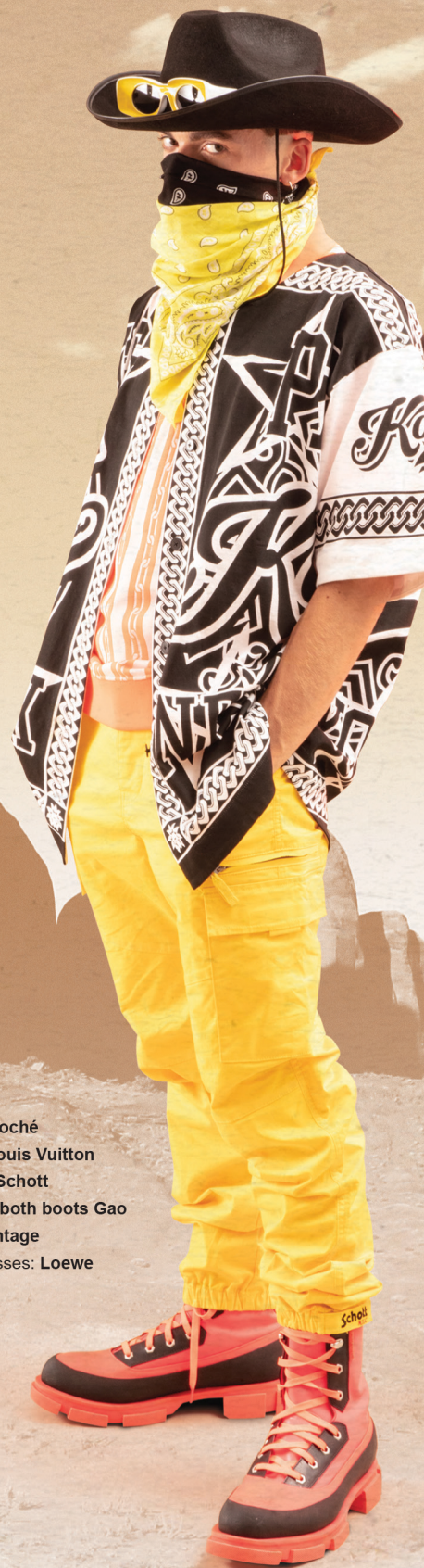
Shirt: Koché Polo: Louis Vuitton Pants: Schott Shoes: both boots Gao Hat: Vintage Sunglasses: Loewe

Pour finir, sachez que SS20 a bien décidé d'attraper au lasso cette vibe western. Martine Rose nous le prouve une fois encore avec ses chemises recouvertes de fils et la marque chinoise Sankuanz livre une interprétation beaucoup plus punk : des clous et des motifs tribaux s'apposent sur les denims. Du denim encore pour la jeune marque Casablanca qui ponctue ses ensembles d'imprimés colorfull aux inspirations mexicaines. Pour sa collection Resort 2020, Balmain propose un chapeau de sombrero en cuir surdimensionné puis une jacket et un poncho entièrement tressés conçus à la manière des tapis en osier.