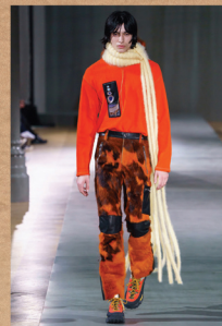
Acne Studios Fall 2019