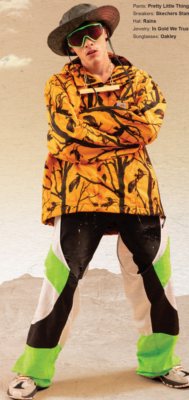
Jacket: Carhartt WIP Pants: Pretty Little Thing Sneakers: Skechers Stamina Hat: Rains Jewelry: In Gold We Trust Sunglasses: Oakley