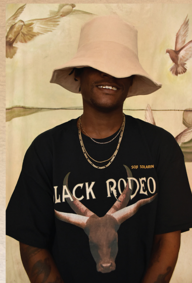
Soji Solarin Negro Cowboy collection Fall 2019