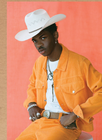
Lil Nas X pour Teen Vogue Juin 2019