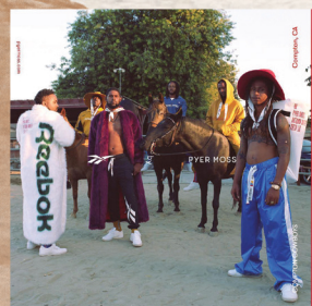
Campton Cowboys pour la campagne Pyer Moss x Reebok