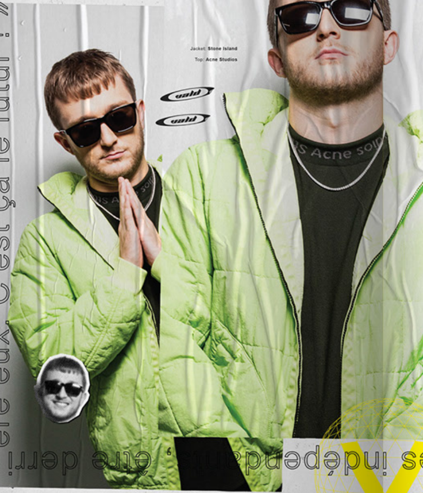
Jacket: Stone Island Top: Acne Studios

Dans tes interviews concernant ce nouvel opus, trois mots reviennent constamment : dépression, impôts, indépendance . Des mots-clés à ajouter ? Original, très gros rap et je dirais dur. Grave dur même.