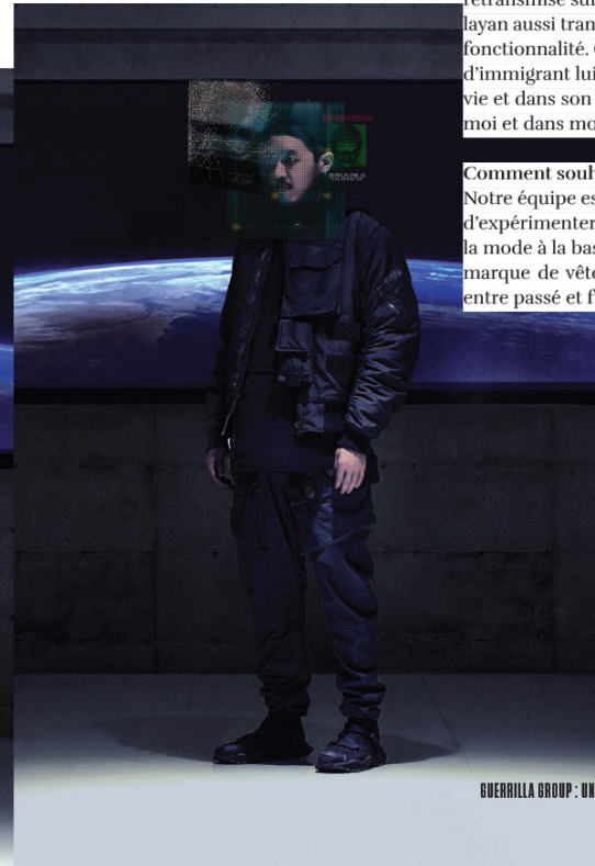
GUERRILLA GROUP : UN ASTRE À PART / SHOES UP 060 / 150

Notre équipe est réduite donc nous devons trouver des moyens d'expérimenter et de repousser les limites. N'étant pas issus de la mode à la base, nous ne voulons pas nous limiter en tant que marque de vêtements et nous voulons embrasser les dualités entre passé et futur, et entre les disciplines.