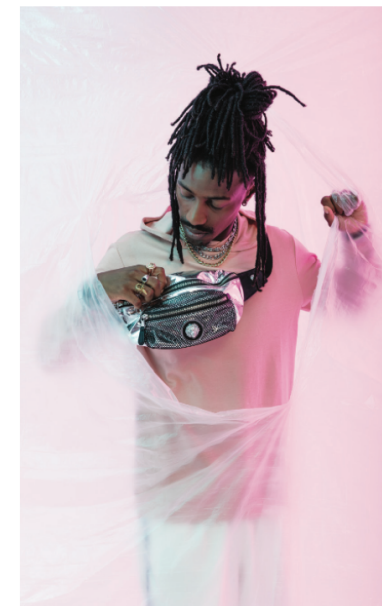
OLD PEE SWEAT: ONLY & SONS ( disponible sur zalando.com ) JEWELRY: Versus Versace ( disponible sur zalando.com ) WAIST BAG: Versus Versace ( disponible sur zalando.com )