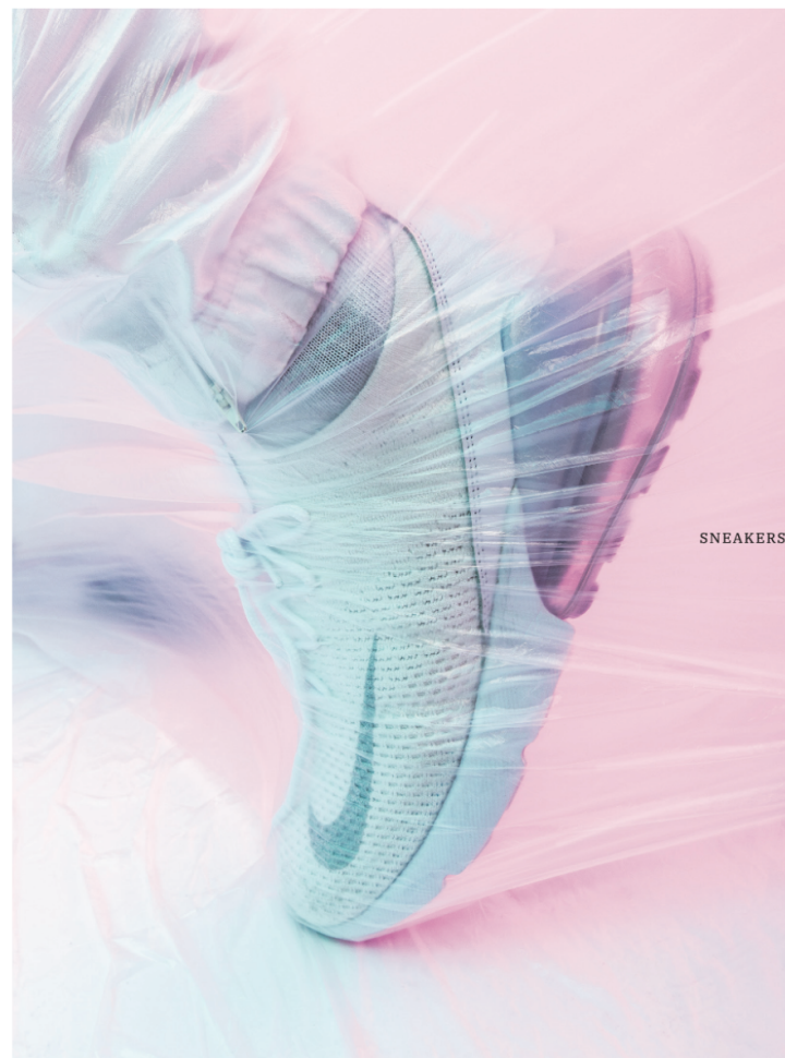
SNEAKERS: Nike Air Max 270

J'ai lu un commentaire qui disait « en espérant qu'ils ne se séparent pas comme la MZ ». Sans évoquer l'idée d'une séparation car vous avez l'air très soudés, pourriez-vous sortir des projets en solo ?